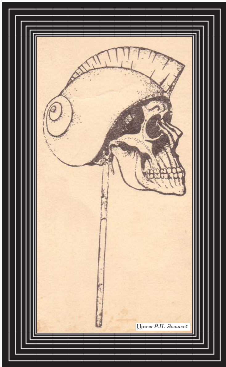
Цртеж Р.П. Звишкој

Дакле, за хипокризију. Мислим да сам довољно указао на дубине и