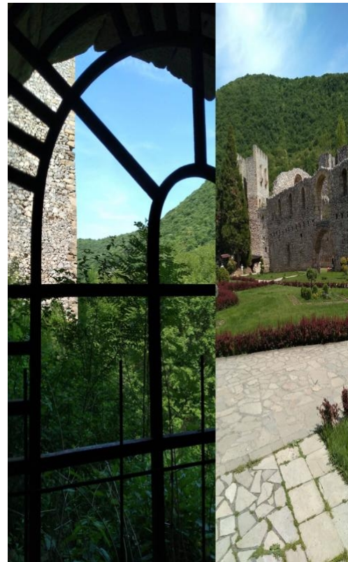
(Манастир Манасија, после Бурђевдана 2020.)